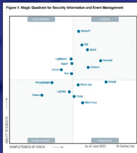
Sumo Logic als Visionary im 2022 Gartner® Magic Quadrant™ für SIEM

Ermöglichen Sie datengesteuerte Geschäftsentscheidungen und prognostizieren und analysieren Sie das Kundenverhalten mit der Sumo Logic-Plattform für Echtzeitanalysen.